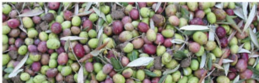
Récoltes d'olives, Italie

Depuis 1996, il est Professeur à l'Université de la Méditerranée au Centre d'Océanologie de Marseille et depuis 2001, Directeur de l'Institut Océanographique (Fondation Albert 1er, Prince de Monaco, reconnue d'utilité publique à sa création en 1906).