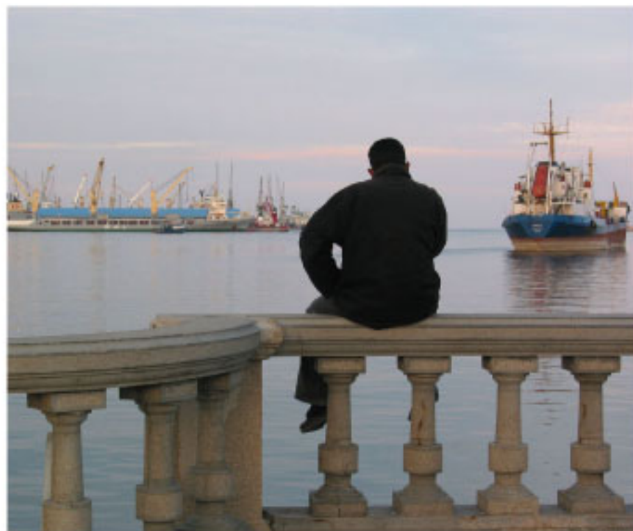
Port de Tripoli

Cette dernière journée est consacrée aux grands dossiers actuels et aux enjeux que nous devons relever. La Méditerranée, zone de fractures, est encore le théâtre de crises et de conflits qui empoisonnent les relations internationales. Le chemin à