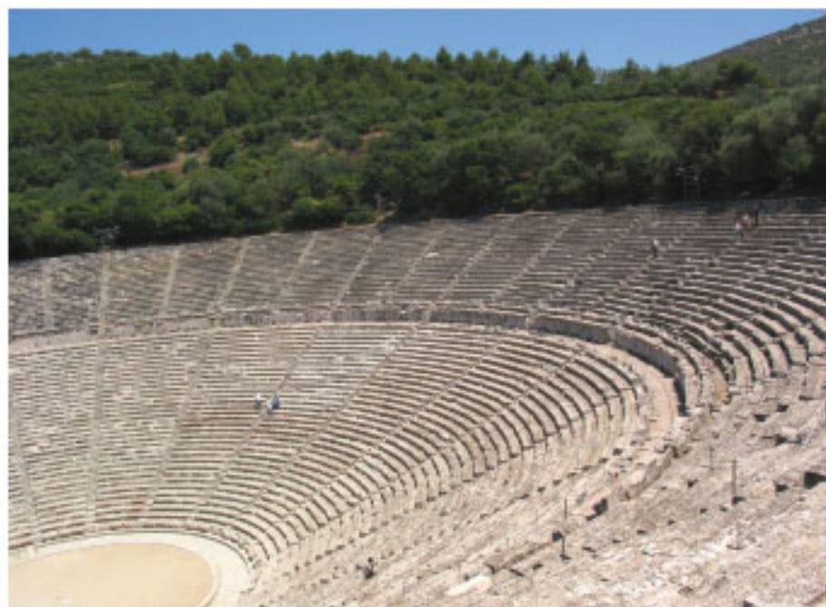
Theatre d'Epidaure, Grèce

Il est l'auteur-interprète d'une pièce de théâtre mathématiques "One-Zéro Show" et "Du Point ..... à la Ligne" .