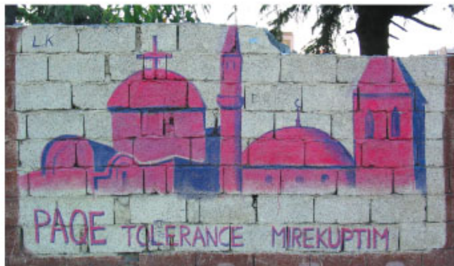
Paix et tolérance, Alliance

Ses distinctions : Palmes Académiques (officier), Légion d'Honneur (officier)